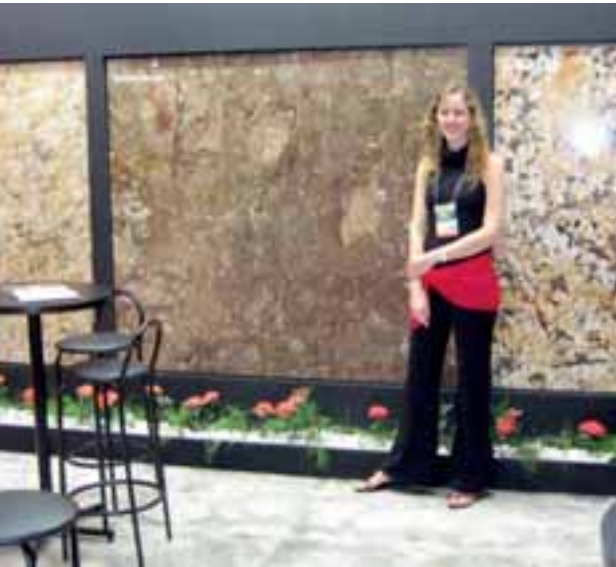
TORRONE BROWN von MP Granitos mit Hostess