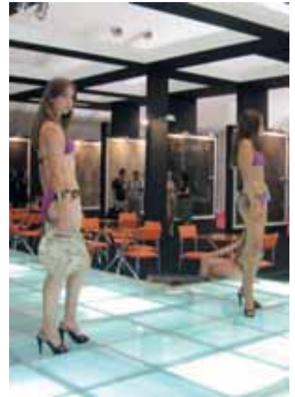
Natursteinmode von Antolini do Brasil

Zwar ist inzwischen, wie Mameri ausführte, das Projekt einer Eisenbahnlinie vom Branchenzentrum in Cachoeiro de Itapemirim zum Hafen in Vila Velha mit Anschluss an einen zweiten Hafen auf halbem Weg auf den Weg gebracht. Von Beobachtern aber wird die geplante Fertigstellung bis 2010 angezweifelt.