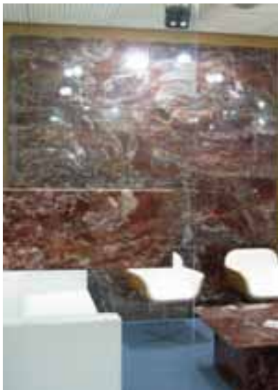
BLUES DEL FUEGO von Gramil.

Art von neuem Wohnzimmer entwickelt habe. Folglich wollten die Eigenheimbesitzer den Raum hochwertig ausstatten, und dies nicht nur mit Arbeitsplatten oder Böden aus Granit, sondern auch mit Fliesen aus Naturstein an den Wänden. »Die Kunden wollen mehrere Sorten in der Küche haben«, so eine der Erkenntnisse aus der Studie.