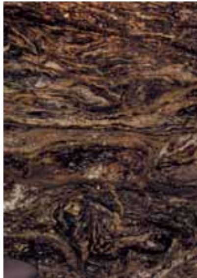
TIGERISH von Mameri Rochas